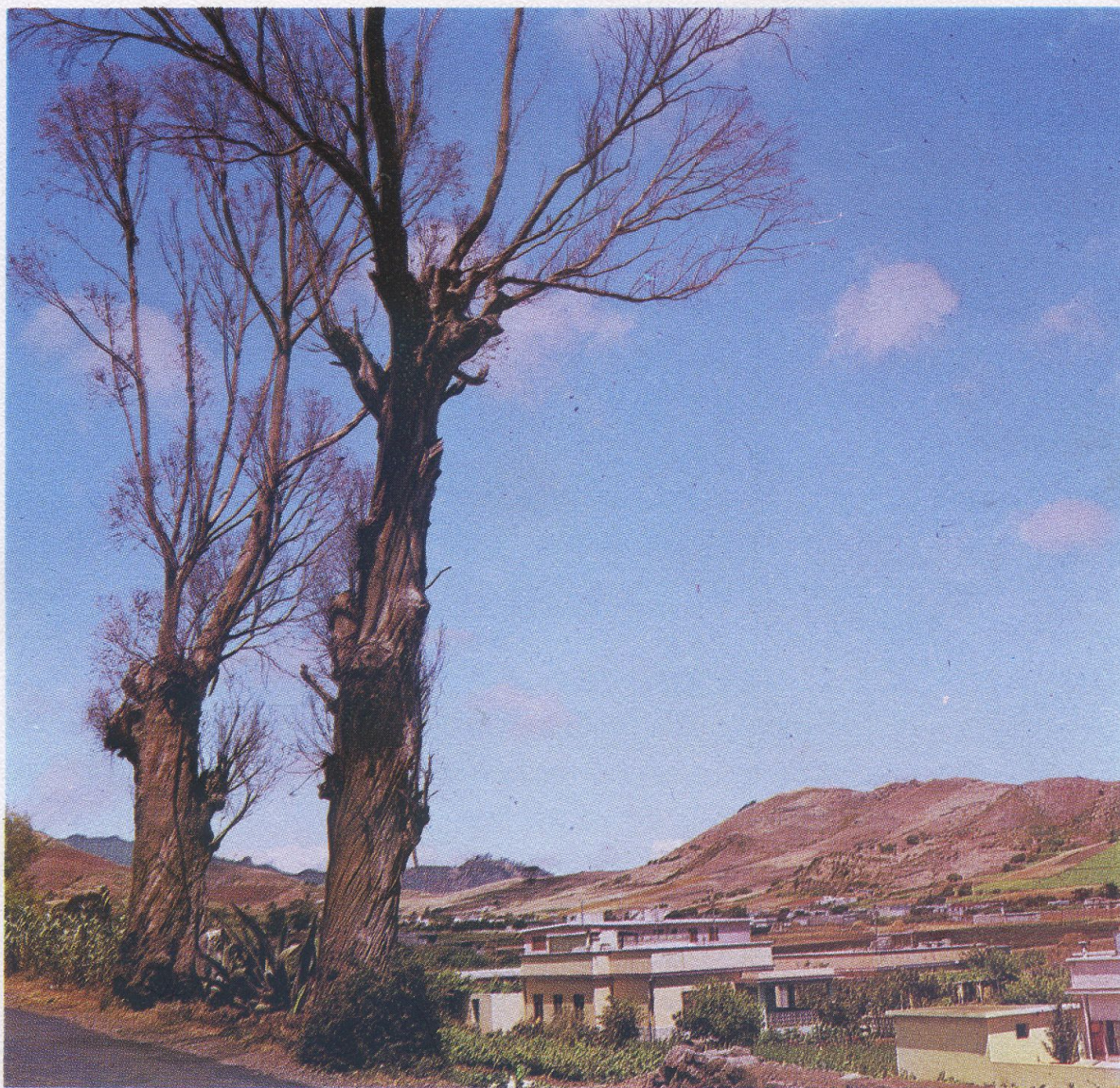
La Carretera de Tejina, recién incorporada a los adelantos técnicos del asfalto y el contraste del paisaje de la feraz vega de Las Mercedes.