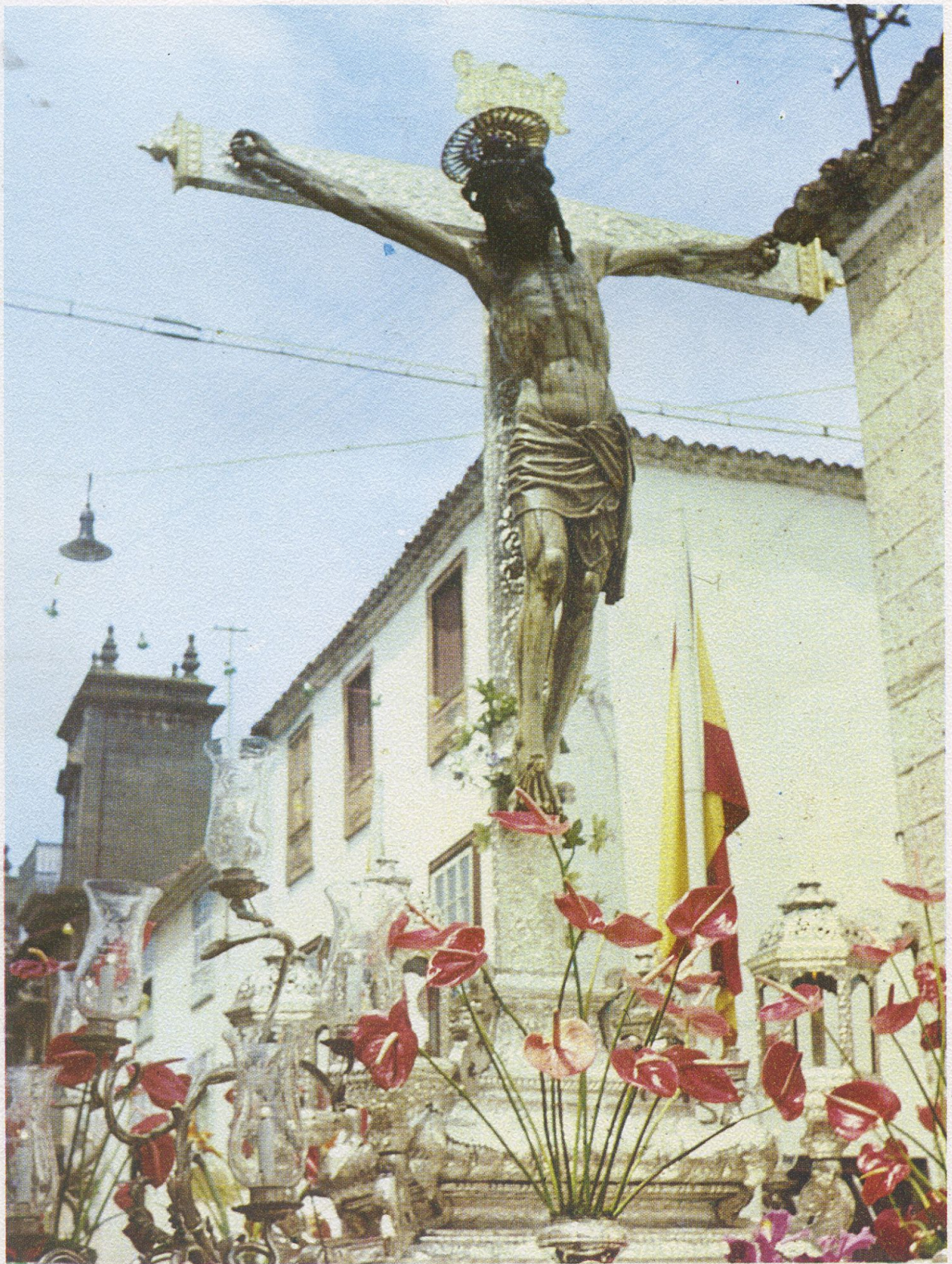
El Santísimo Cristo de La Laguna, en la Procesión del Retorno al Real Santuario de San Miguel de las Victorias.