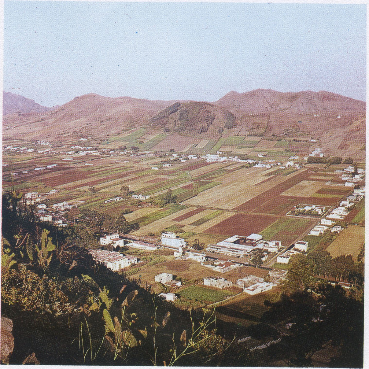
Bello rincón lagunero desde donde se dominan "Los Llanos de La Laguna".