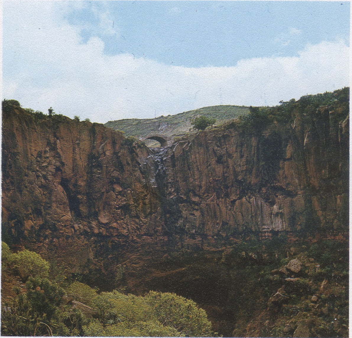
Paraje desde donde se ofrece este inédito fenómeno volcánico de Valle Jiménez (La Cuesta de Arguijón).