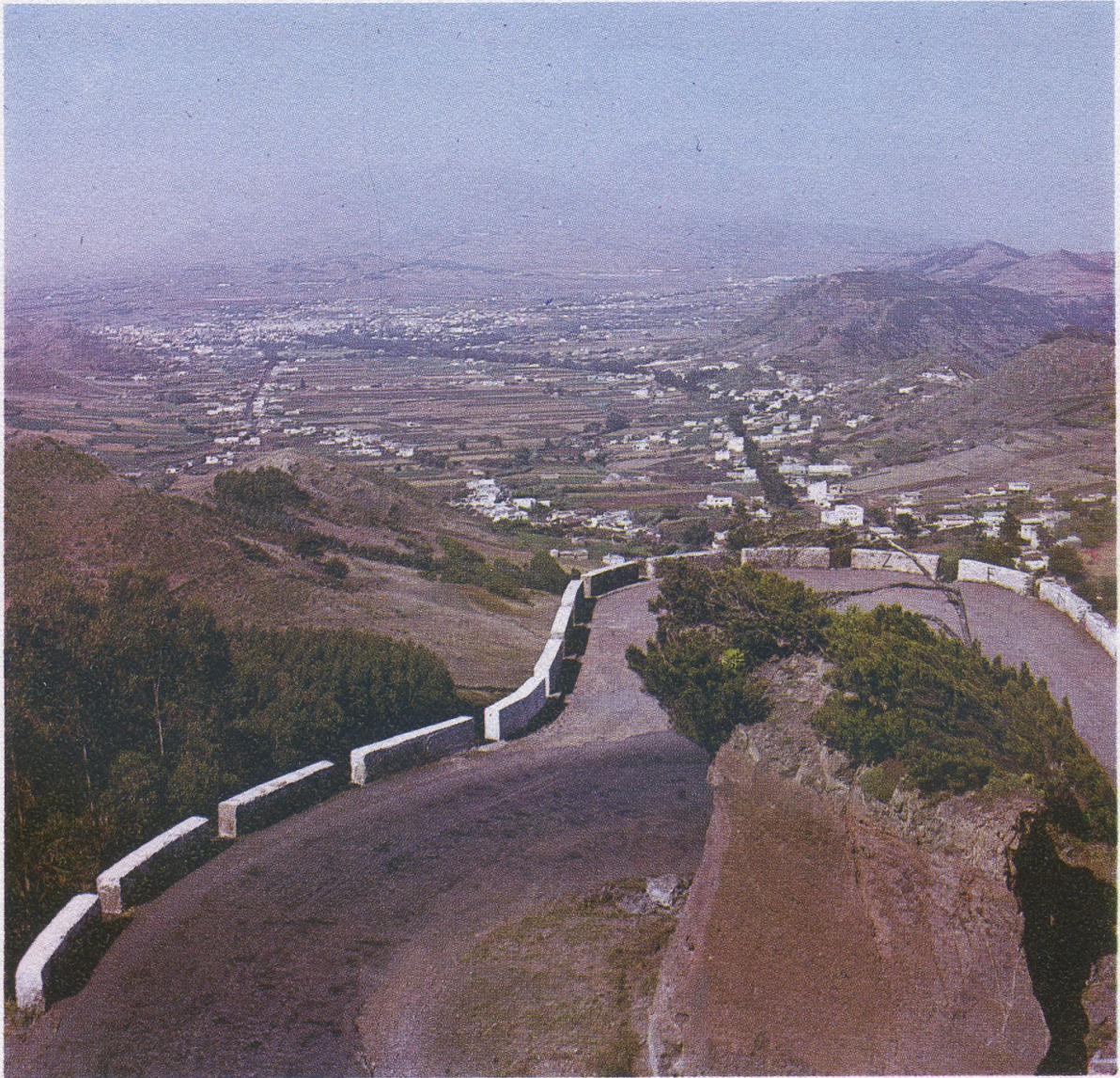
El mirador del Diablo en Las Mercedes. Desde él se contempla el ubérrimo valle de Agüere y la campiña de Las Mercedes.