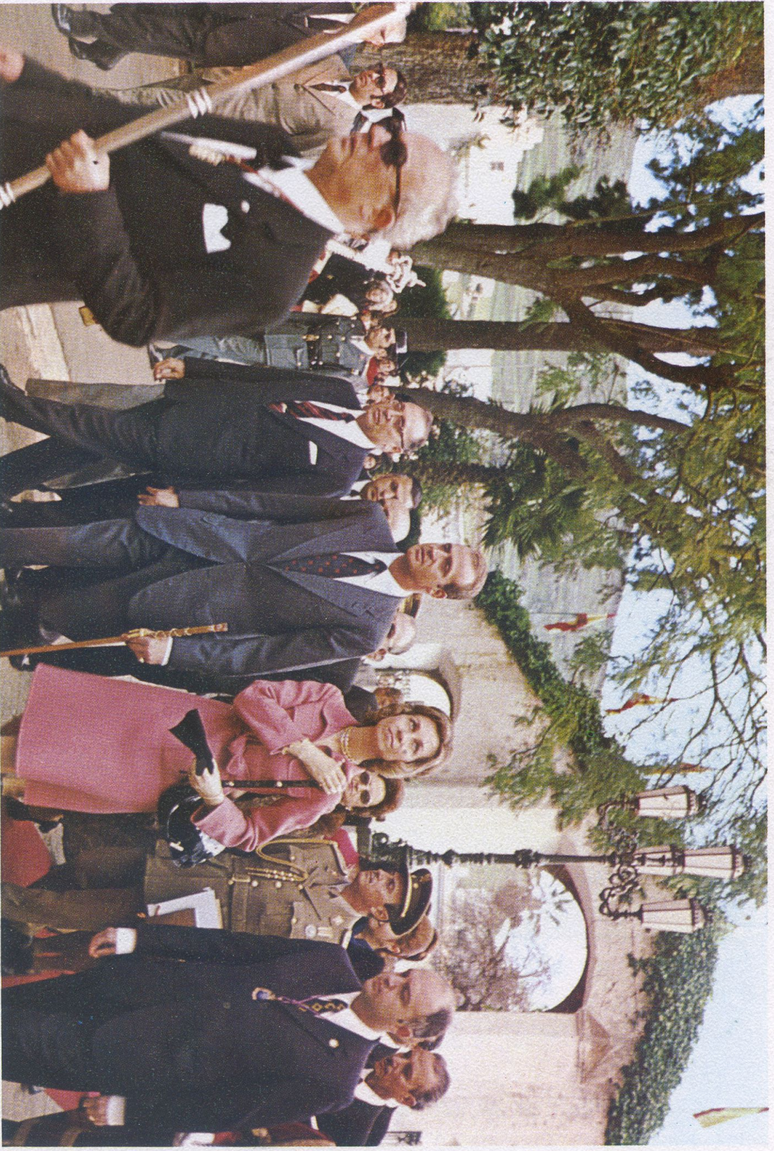
"Por los viejos pórticos pasaron legiones de fieles de toda condición y linaje, a rendir pleitesía al Cristo de San Miguel de las Victorias. Desfilaron bajo sus arcos las Levas para Flandes, los Tercios para Portugal y Extremadura, las Milicias triunfantes en las invasiones extranjeras, los Corregidores, los Capitanes a Guerra....."