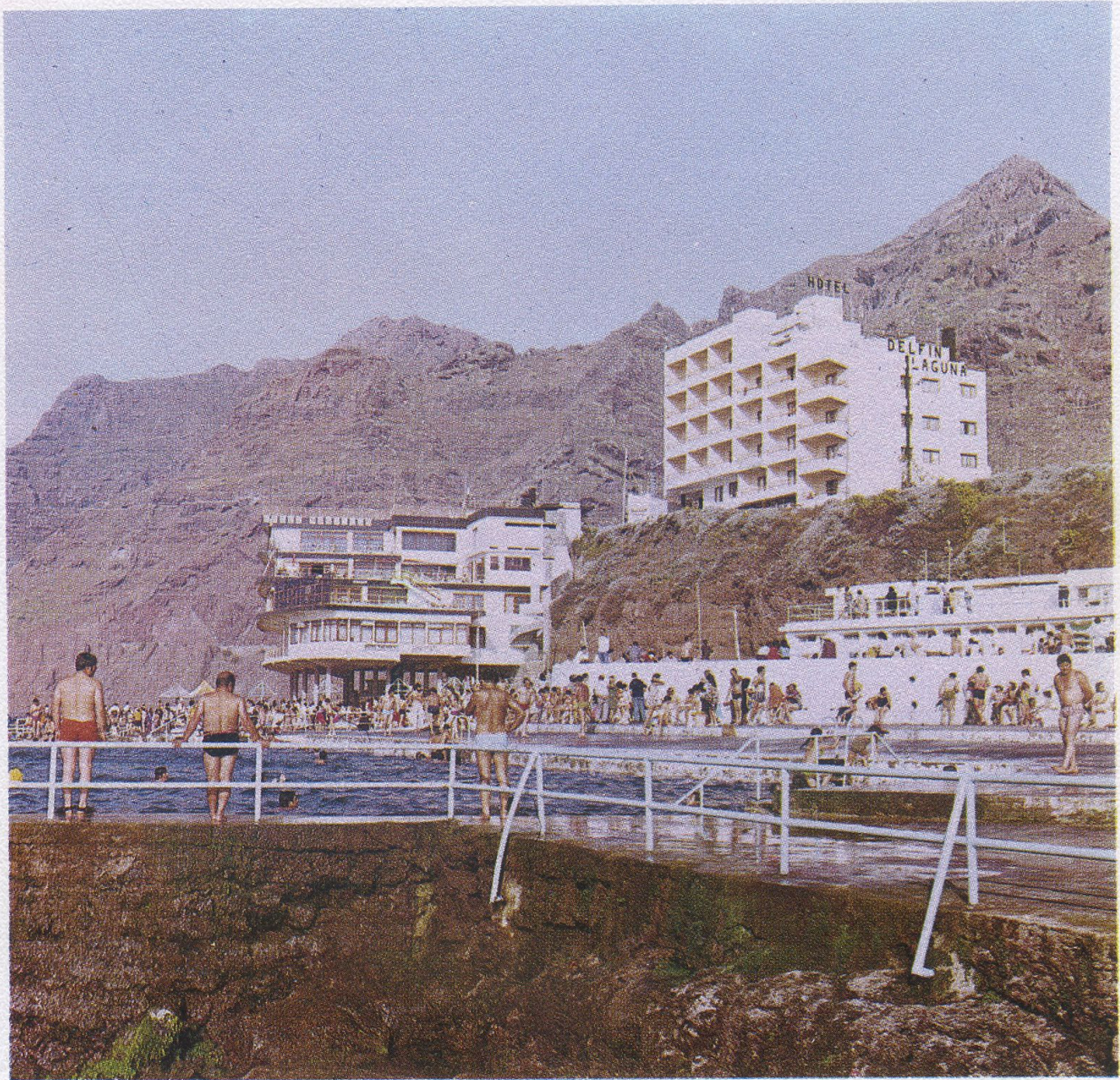
Las Piscinas de Bajamar, con el Hotel Nautilus.