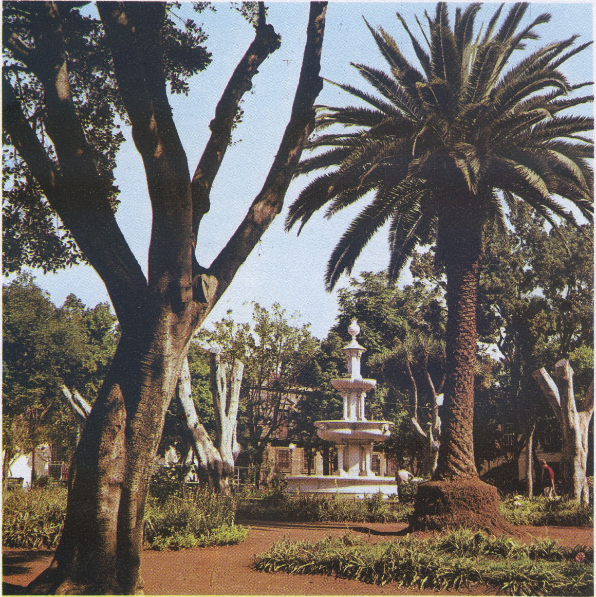
La Fuente de la Alameda del Adelantado, rodeada de los bellos jardines y de especies arbóreas de inigualable belleza.