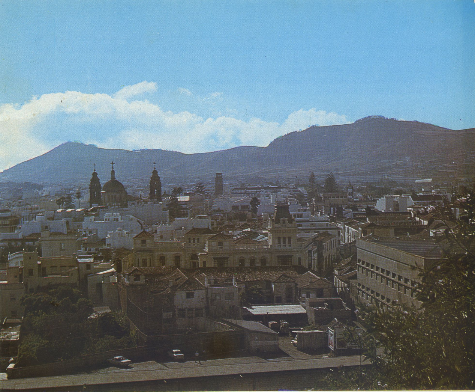
Vista panorámica de la ciudad de San Cristóbal de La Laguna.