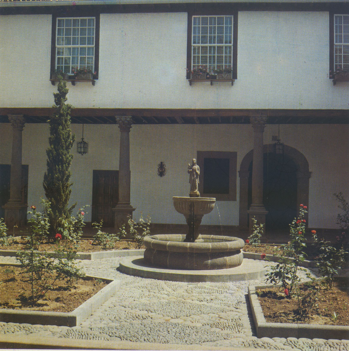
Patio principal del Palacio Episcopal en la Calle de San Agustín.