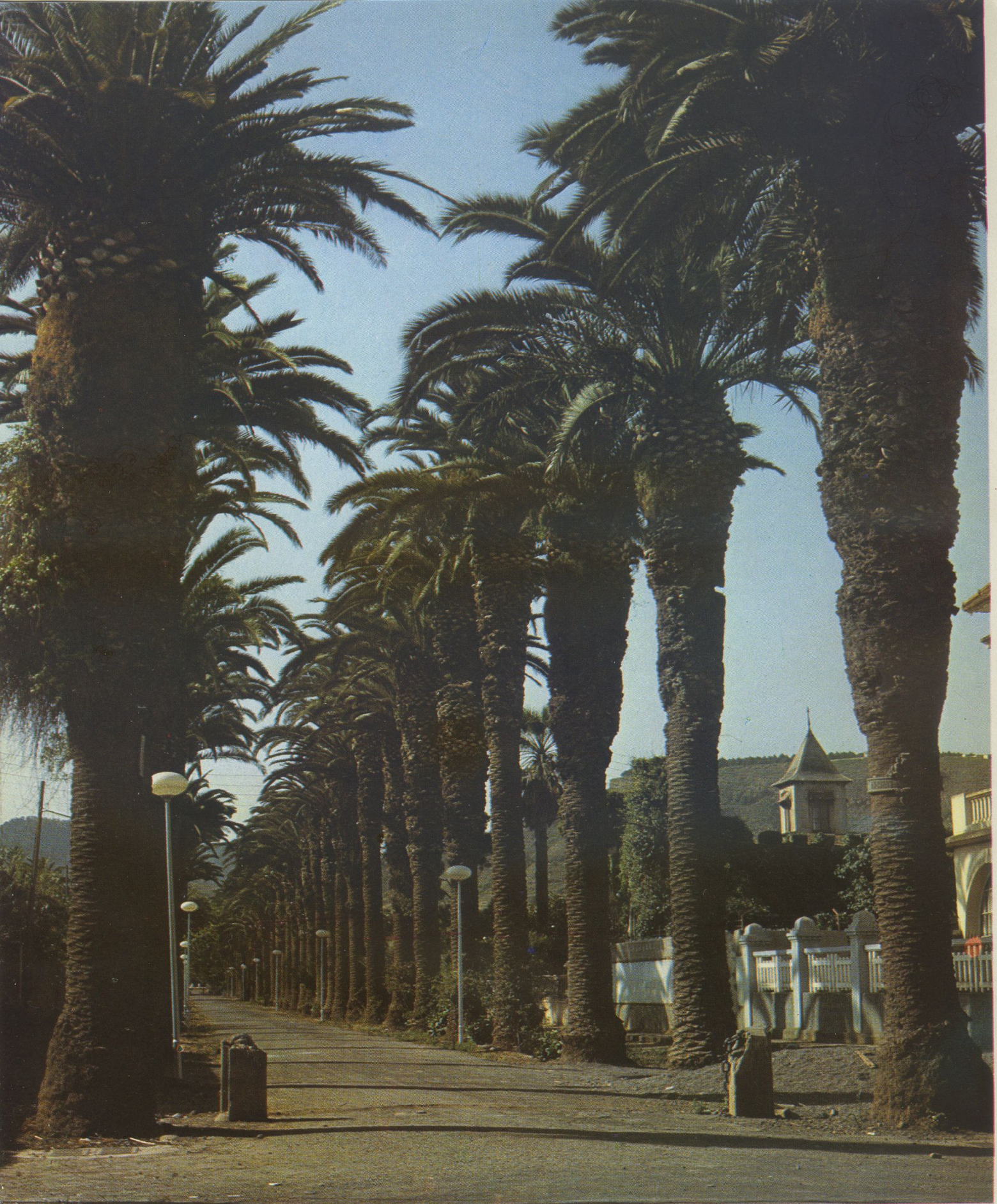
El Camino Largo, uno de los más bellos paseos laguneros, escoltado por esbeltas palmeras.