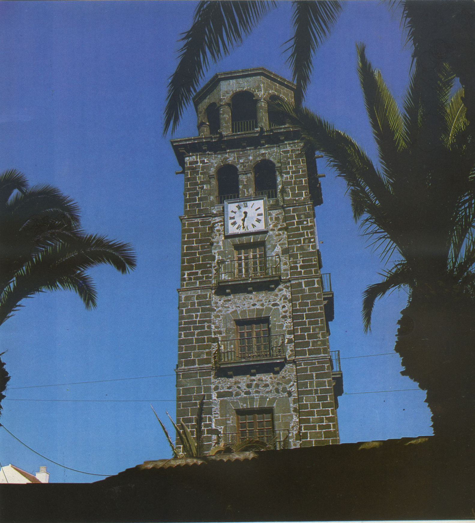
Torre de la Iglesia-parroquia matriz de Ntra. Sra. de la Concepción de La Laguna. Data de medidos del siglo XVI.

Placidez, apacibilidad, cuantas palabras llevan clavadas en su etimología o disuelta en su significación la raíz designadora de la paz pueden aplicarse a la ciudad tinerfeña de San Cristóbal de La Laguna.