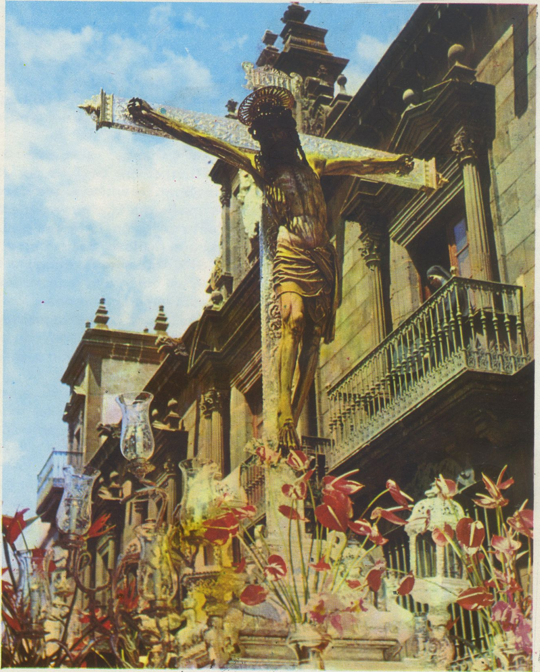
El Santísimo Cristo de La Laguna.