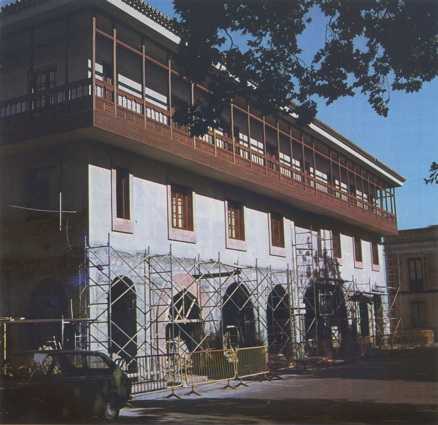
Nuevo Palacio de Justicia de esta ciudad.

Visitar La Laguna es descubrir el espíritu de una ciudad de rancia estirpe española, en que la tradición y la cultura, el arte y la fé, se dan a través de sus muros como el musgo de su grandeza, que hay que refrescar sin estirparla, para que se ofrezca retoñada, lozana y vigorosa a las nuevas generaciones obligadas a saber de todo, pero antes que nada de amor, de amor a la humanidad, a la Patria y al Maestro Divino, que con su doctrina nos redimió y dignificó a todos.