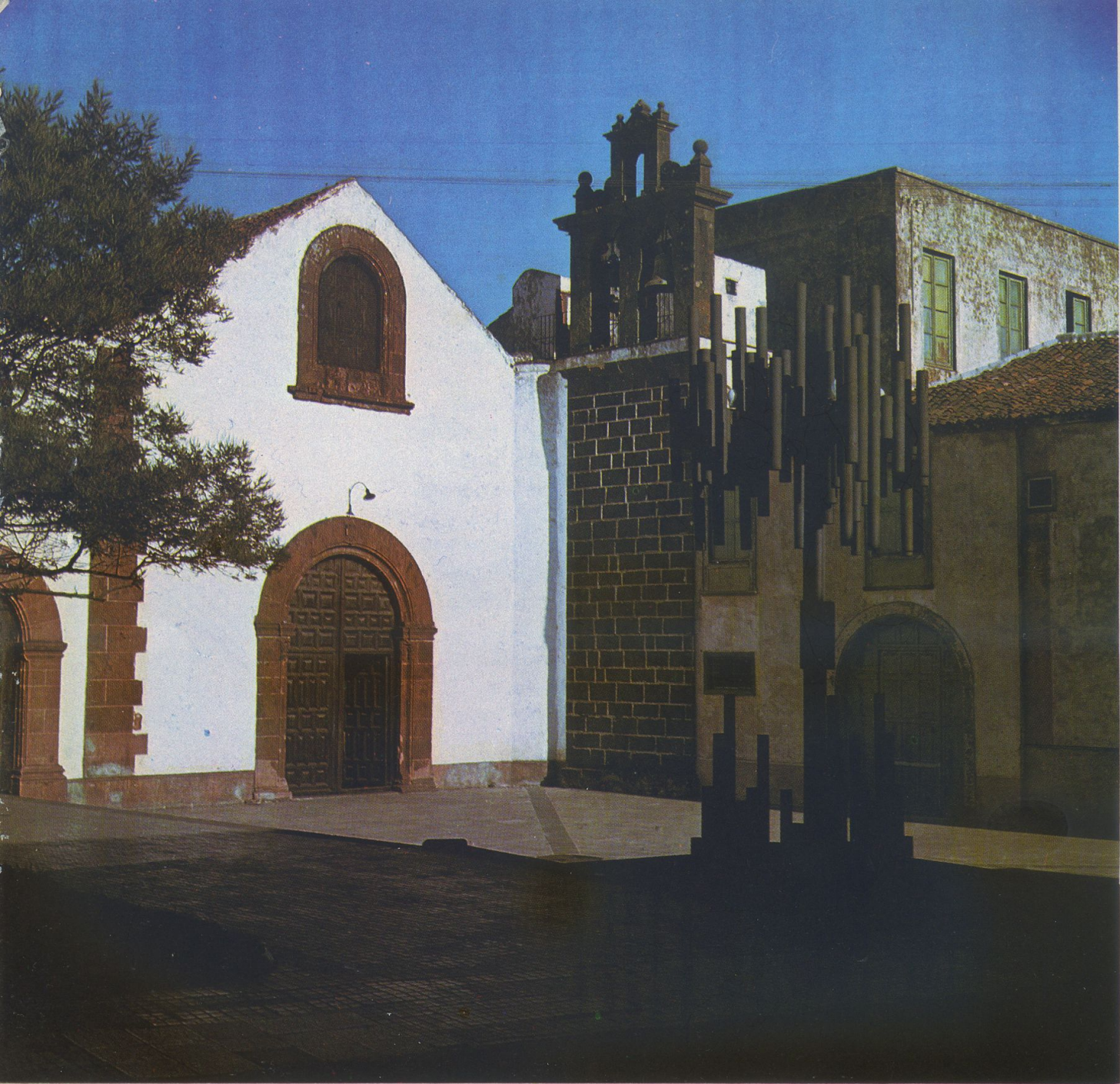
Fachada y espadaña de la actual parroquia de Sto. Domingo de Guzmán, antigua iglesia y convento-estudio dominico de La Laguna. Data de los años 1560-1580.

¡Laguna de Tenerife, la callada la dormida! ¡Cuántas veces, calmados mis instintos errantes, han pronunciado mis labios tu nombre como una amable promesa de paz, de sosiego espiritual! ¡Con cuanto amor, cada vez que la áspera lucha diaria me concede una tregua, vengo a bañar mi espíritu cansado en tu dulce silencio, a la sombra de tus piedras venerables, doradas por el el sol de los siglos!