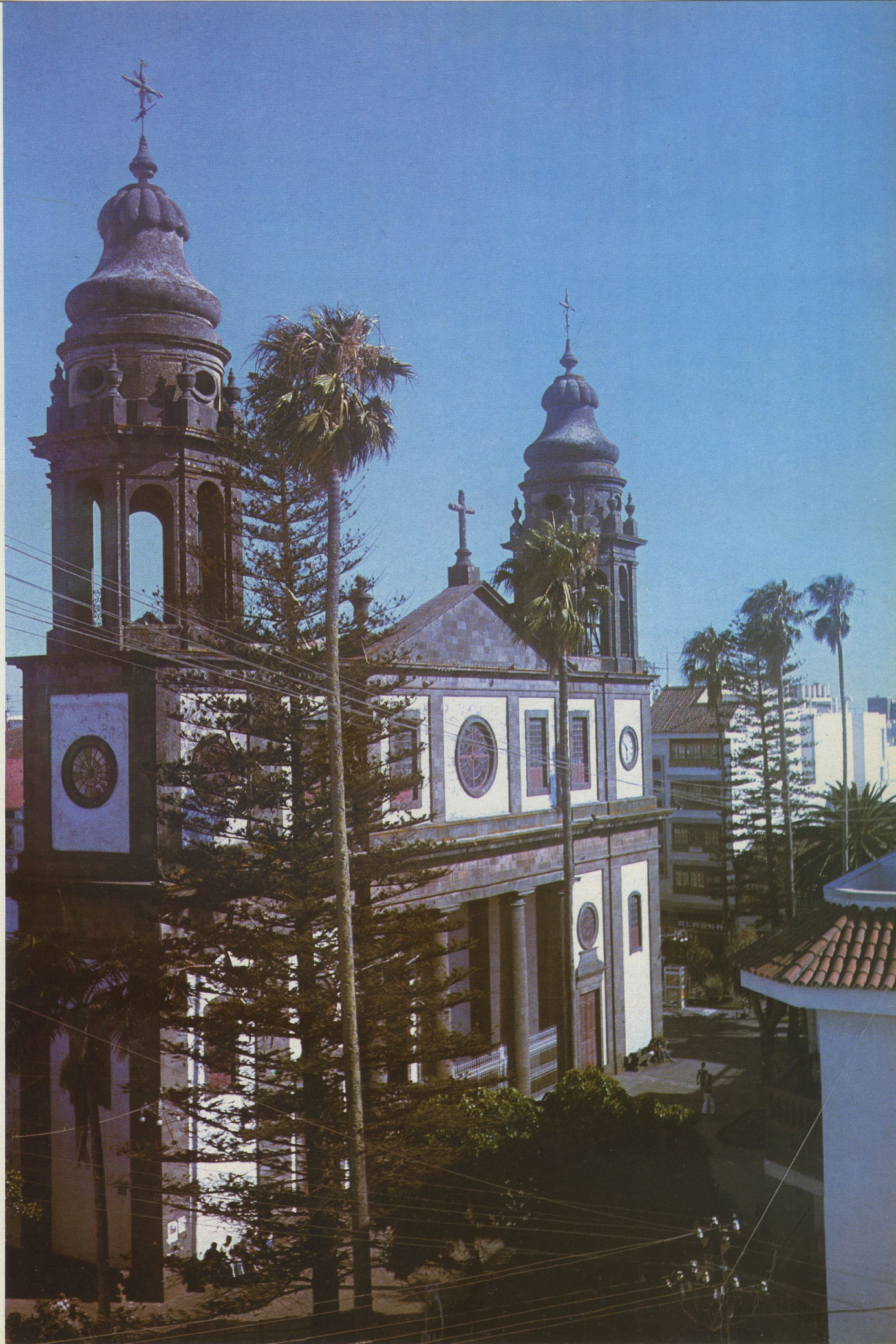
Fachada principal de la antigua parroquia de Los Remedios, hoy Santa Iglesia Catedral de La Laguna.