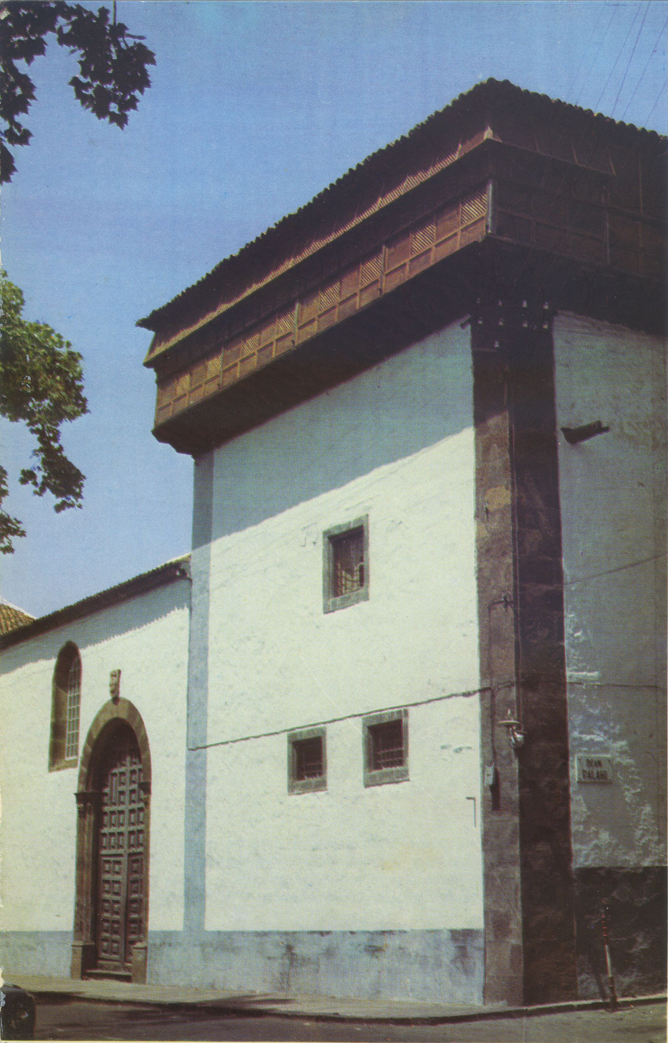
Ajimez y parte de la fachada de la Iglesia-convento de las monjas dominicas de Santa Catalina de Sena. Este monasterio está situado en la Plaza del Adelantado, se supone construido a finales del siglo XV o comienzos del XVI.