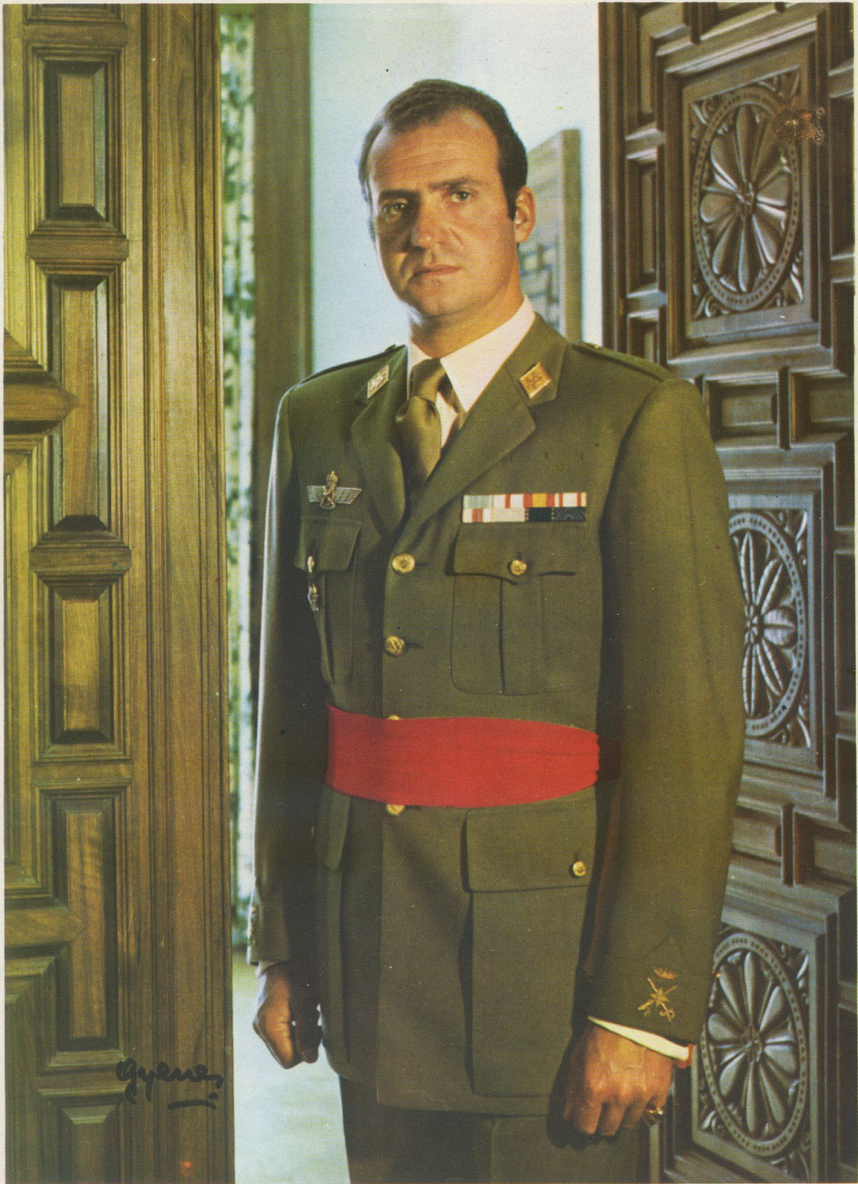
Su Majestad el Rey, Esclavo Mayor Honorario Perpetuo de la Pontificia, Real y Venerable Esclavitud del Santísimo Cristo de La Laguna.