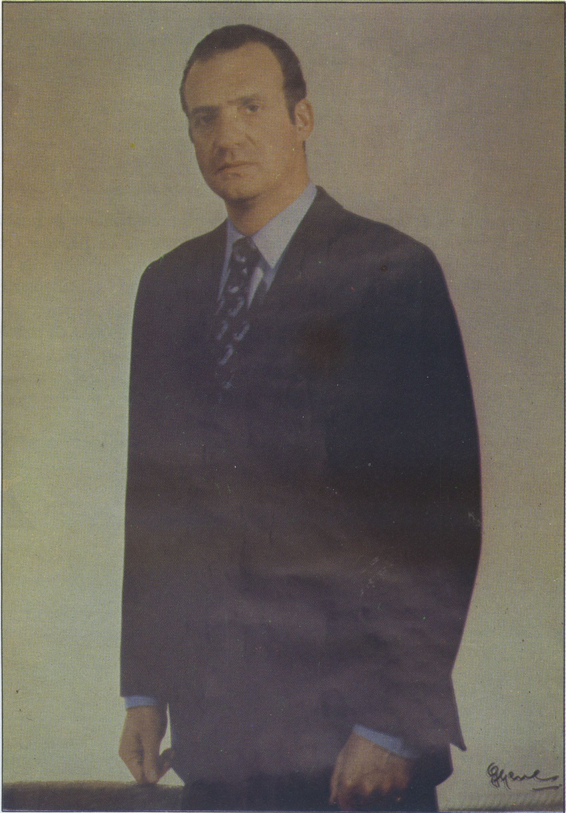
Su Majestad el Rey, Esclavo Mayor Honorario Perpetuo de la Pontificia, Real y Venerable Esclavitud del Santísimo Cristo de La Laguna.