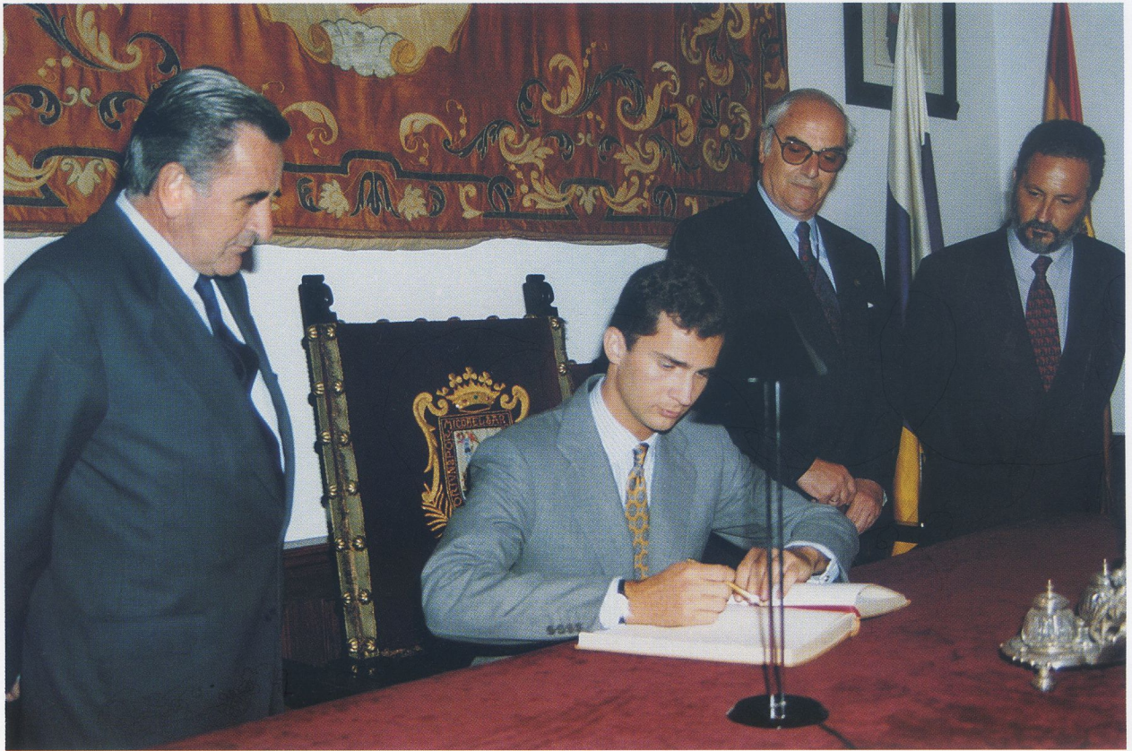
Su Alteza Real el Príncipe de Asturias, Don Felipe de Borbón , firmando en el Libro de Honor del Excmo. Ayuntamiento de La Laguna en su reciente visita a este municipio (6 de julio de 1993).