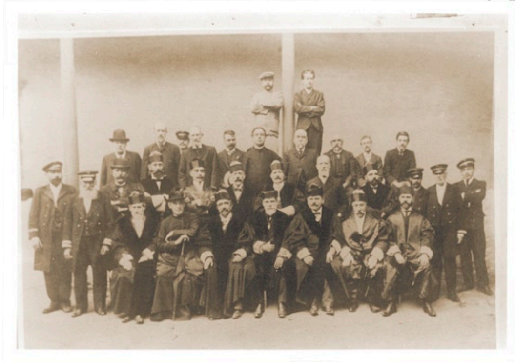
Promoción Instituto de Canarias de finales del siglo XIX | Archivo Municipal | Tamaño real