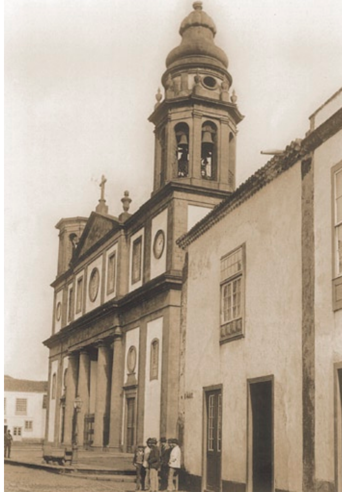
Santa Iglesia Catedral. Finales del siglo XIX