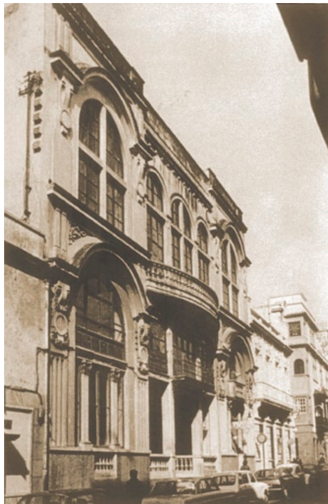
Antiguo Casino de la calle de la Carrera. Años 50