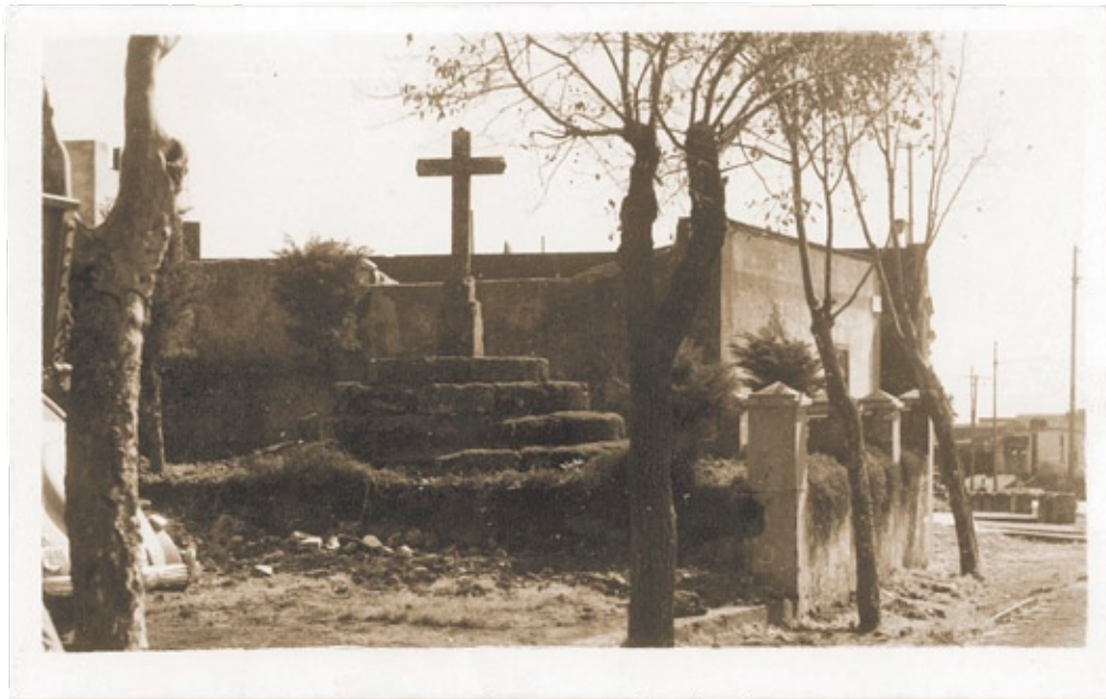
Cruz de Piedra | Archivo Municipal | Tamaño real