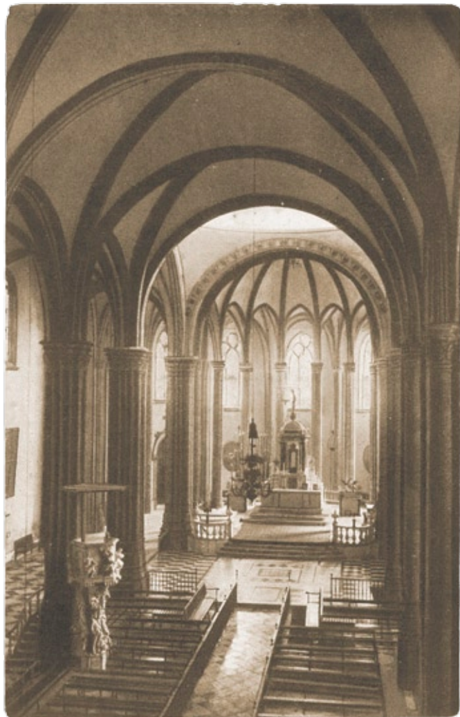
Iglesia de la Catedral (Interior) | Tamaño real