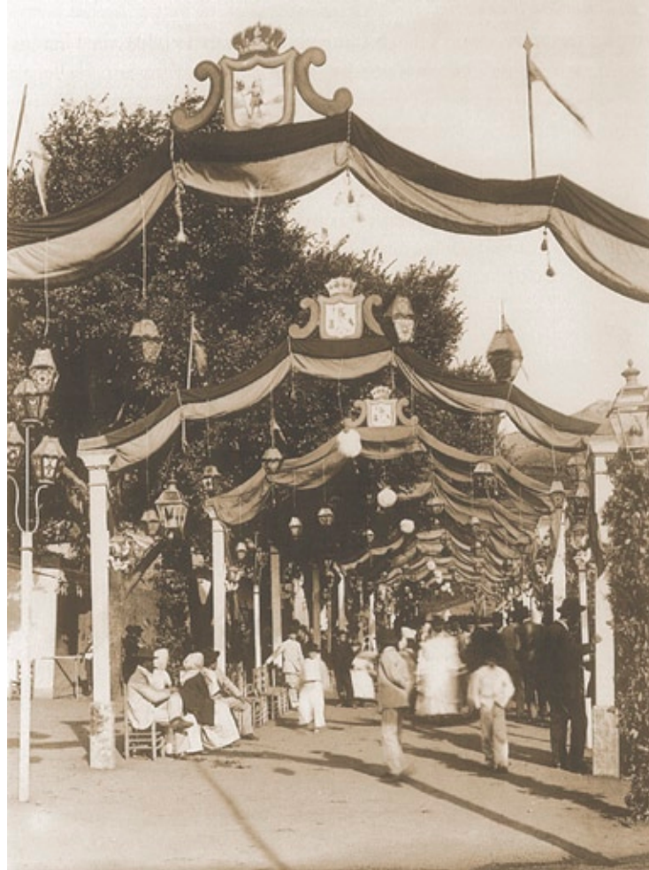
Plaza de San Francisco. Año 1892