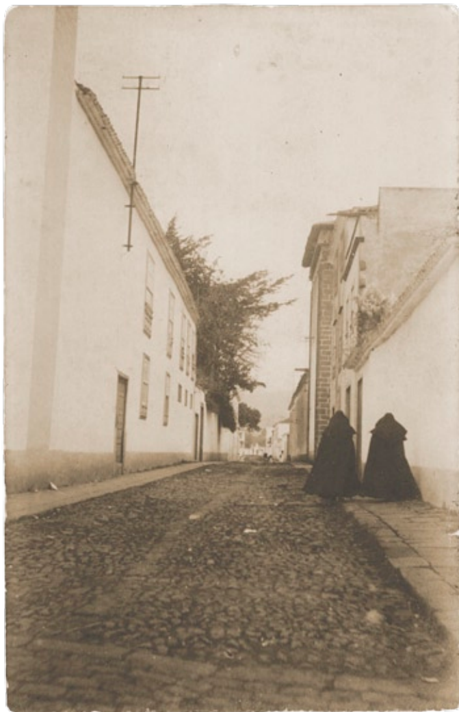
Calle Viana | Tamaño real