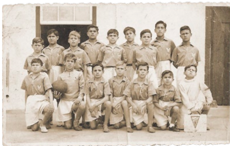
Equipos de fútbol de niños del Colegio Nava La Salle de La Laguna. Campo de fútbol en el patio del Ayuntamiento de La Laguna. Años 50. | Tamaño reducido