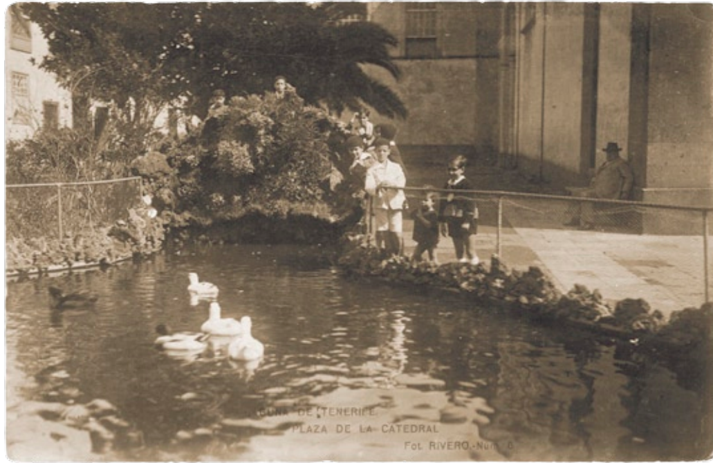
Estanque de los Patos | Tamaño real