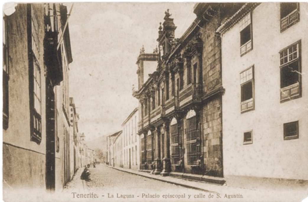
Tenerife. - La Laguna - Palacio episcopal y calle de S. Agustín.