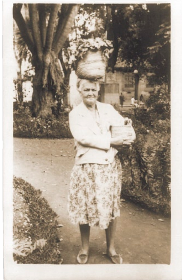
Vendedora lagunera. Años 50