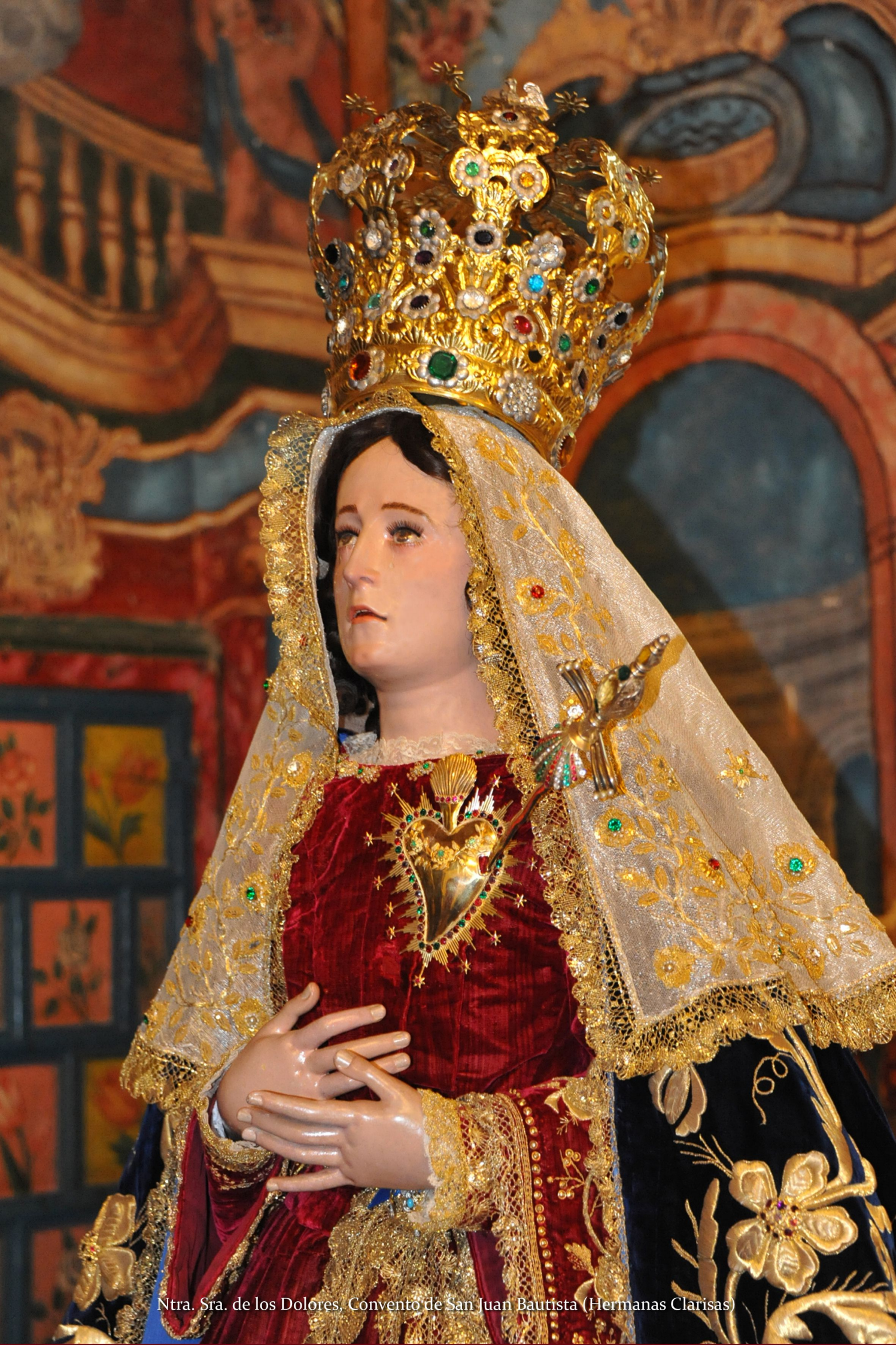
Ntra. Sra. de los Dolores, Convento de San Juan Bautista (Hermanas Clarisas)