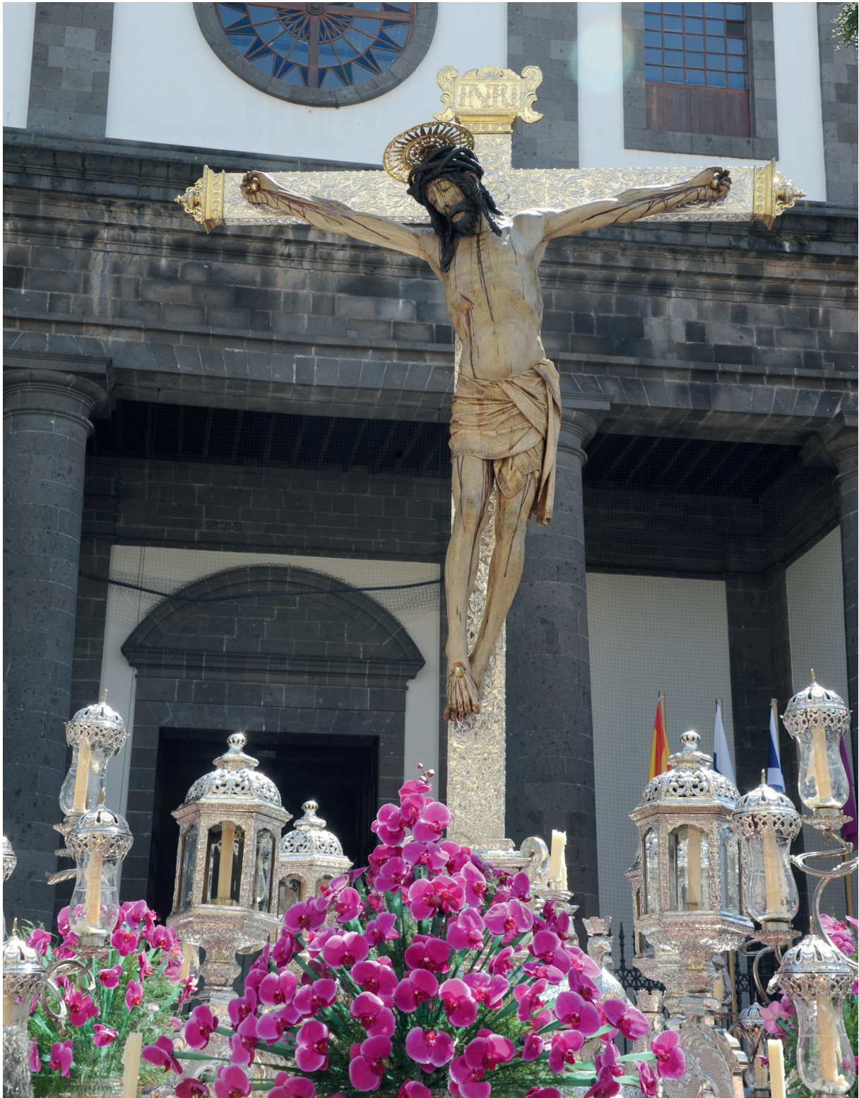
Imagen del Santísimo Cristo de La Laguna saliendo de la Santa Iglesia Catedral el 14 de septiembre.