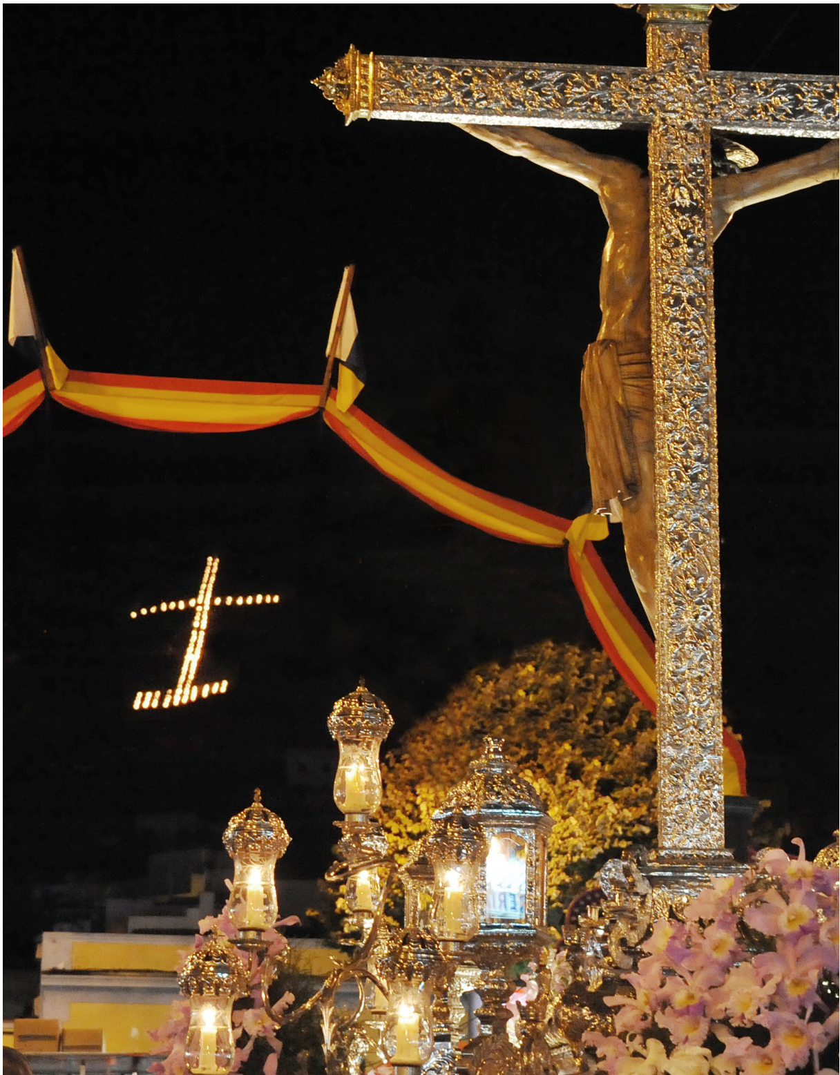
El Santísimo Cristo de La Laguna ante su Cruz ardiente, en la noche del 14 de septiembre.