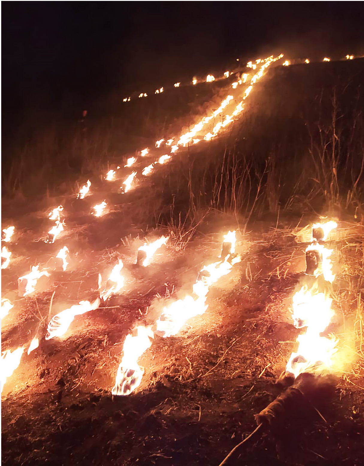
Vista de la Cruz desde la base durante su encendido en la noche del 14 de septiembre de 2022.