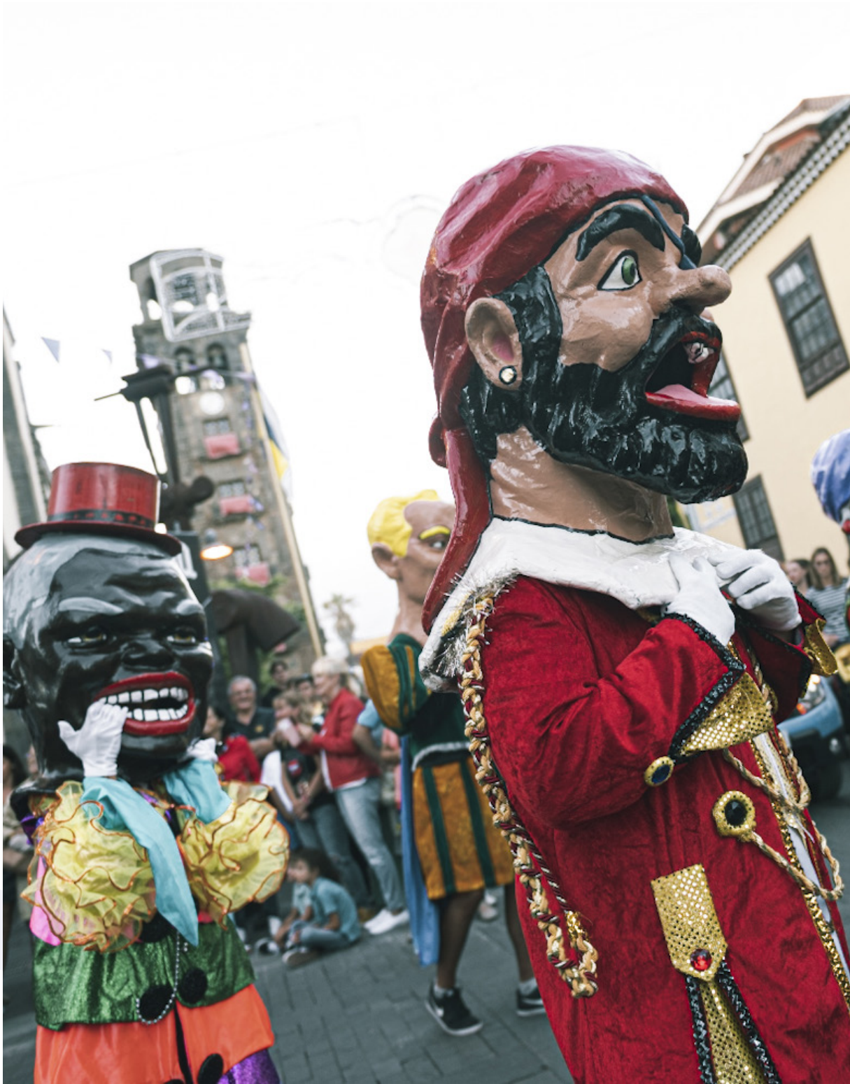
Gigantes y cabezudos en el desfile de la pandorga y los caballitos de fuego, 13 de septiembre de 2022.