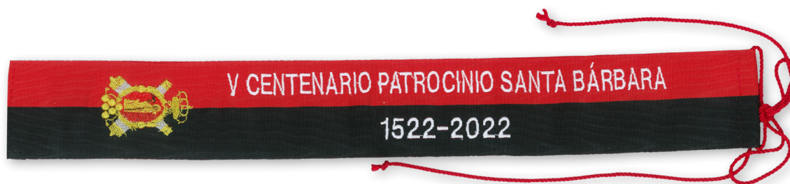
Corbata de la Medalla del V Centenario de Santa Bárbara como Patrona de los Artilleros Españoles.

Españoles a la Pontificia, Real y Venerable Esclavitud del Santísimo Cristo de La Laguna 6 .