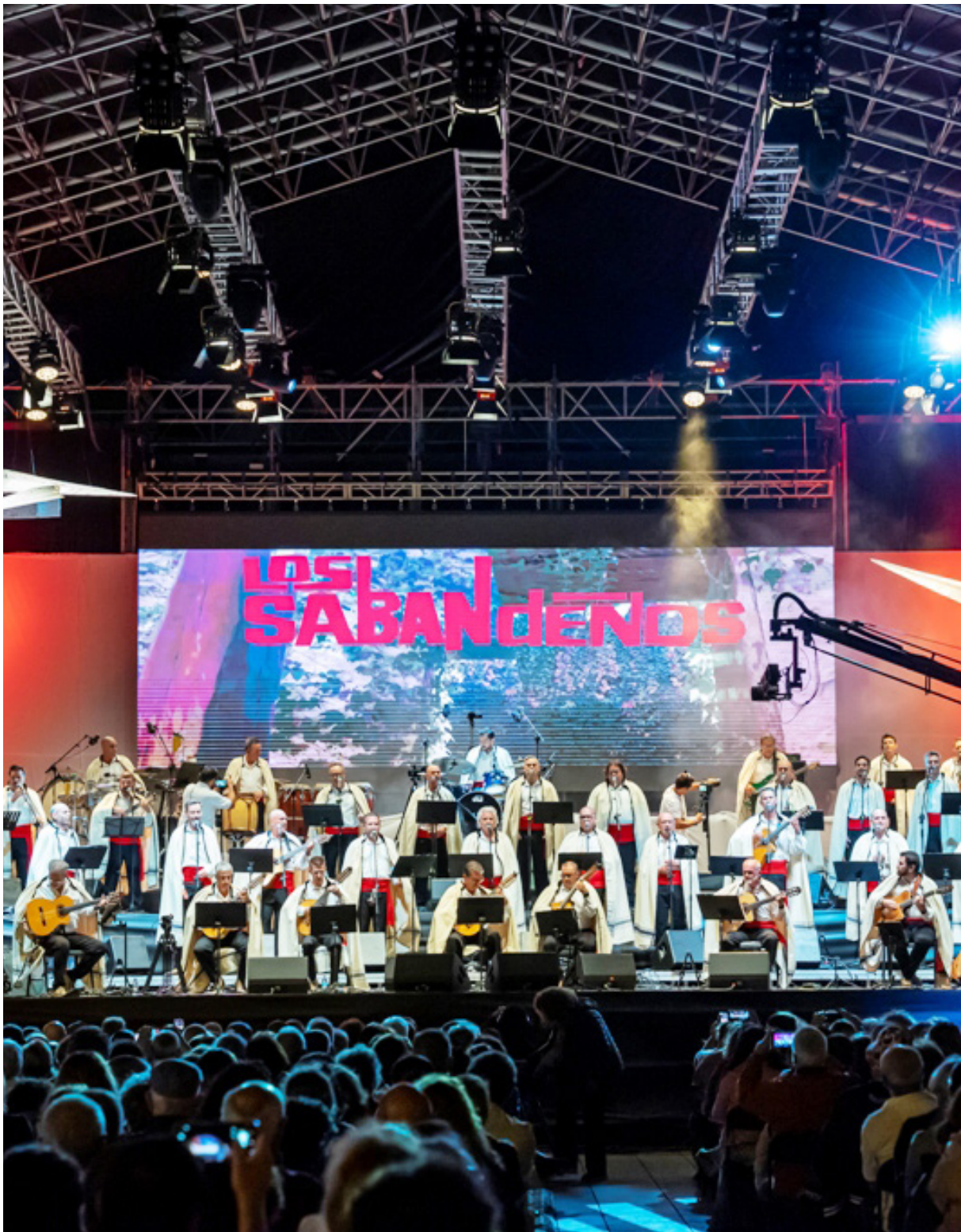
Festival Sabandeños, septiembre de 2022.