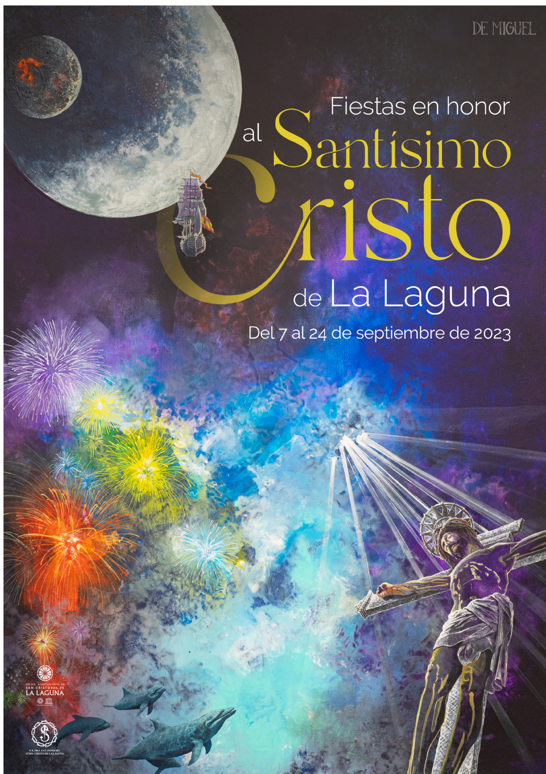
Cartel de las Fiestas en Honor al Santísimo Cristo de La Laguna 2023, obra de Fran "de Miguel".