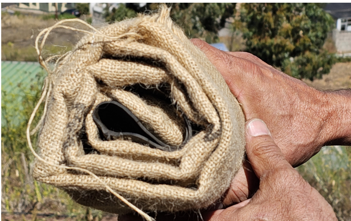
Detalle de uno de los “gánigos” que se utilizan en la actualidad.

forman el Rosario, impregnándolos con gas-oíl ecológico (e-Diesel), para que estén bien mojados y puedan arder de la mejor manera por la noche.