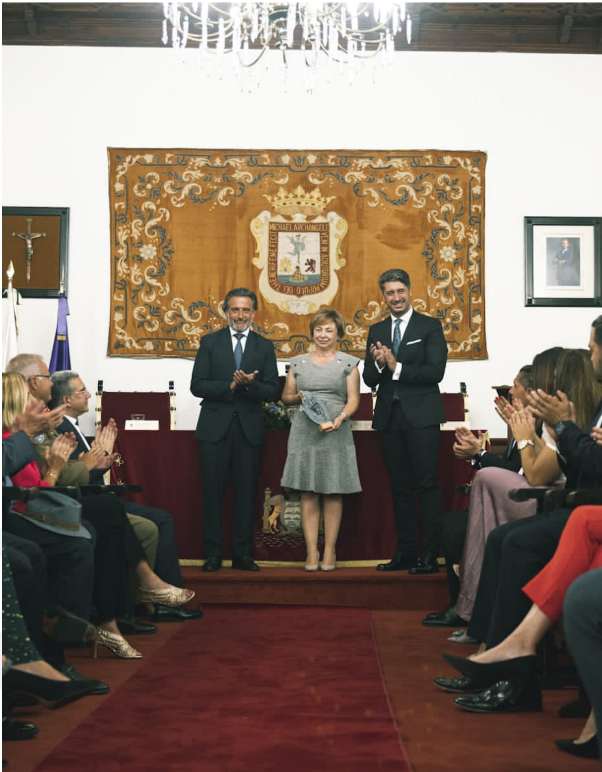
Acto de lectura del pregón de las Fiestas del Santísimo Cristo de La Laguna 2022.