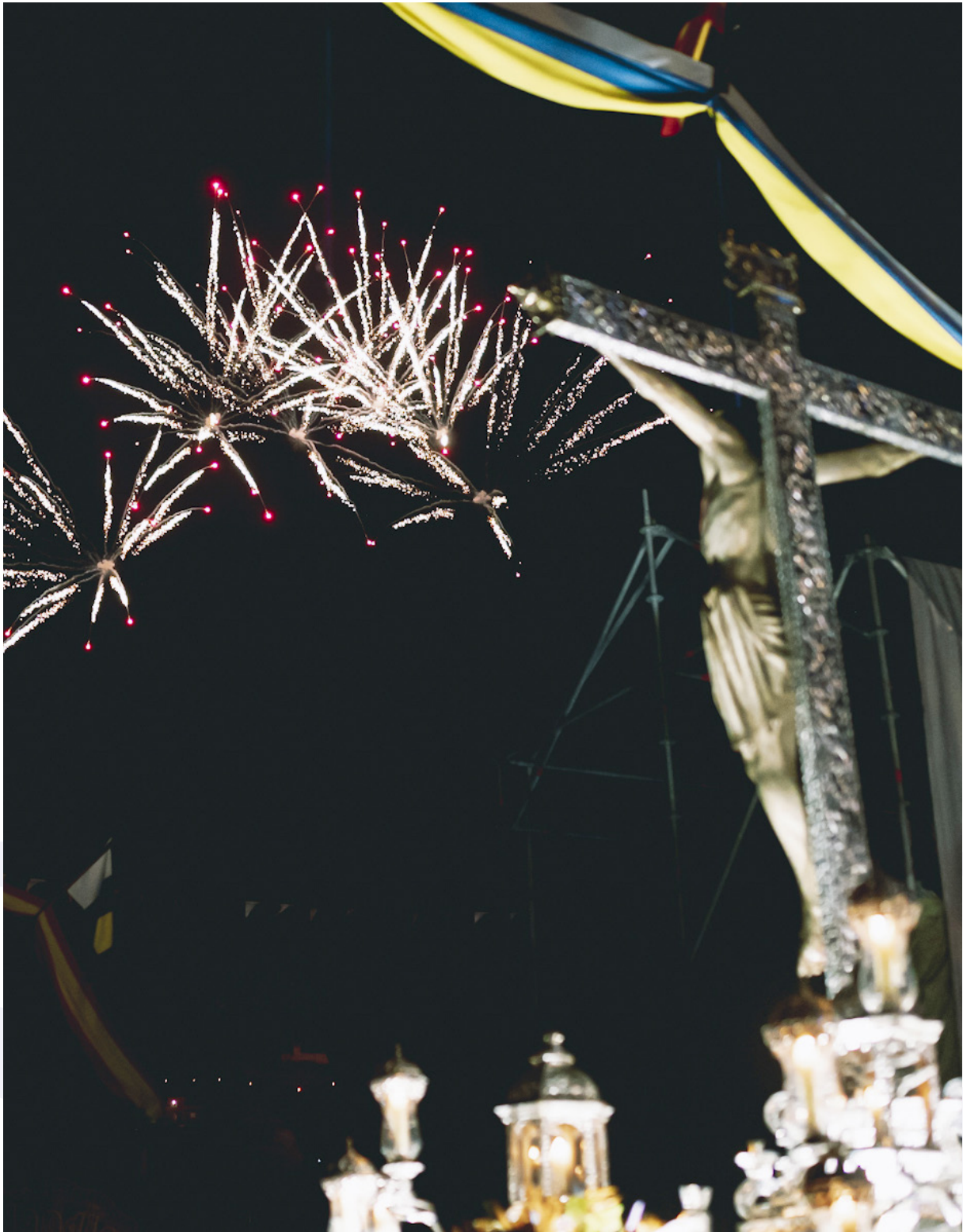
Exhibición pirotécnica de la octava ante la imagen del Santísimo Cristo de La Laguna, 21 de septiembre de 2022.