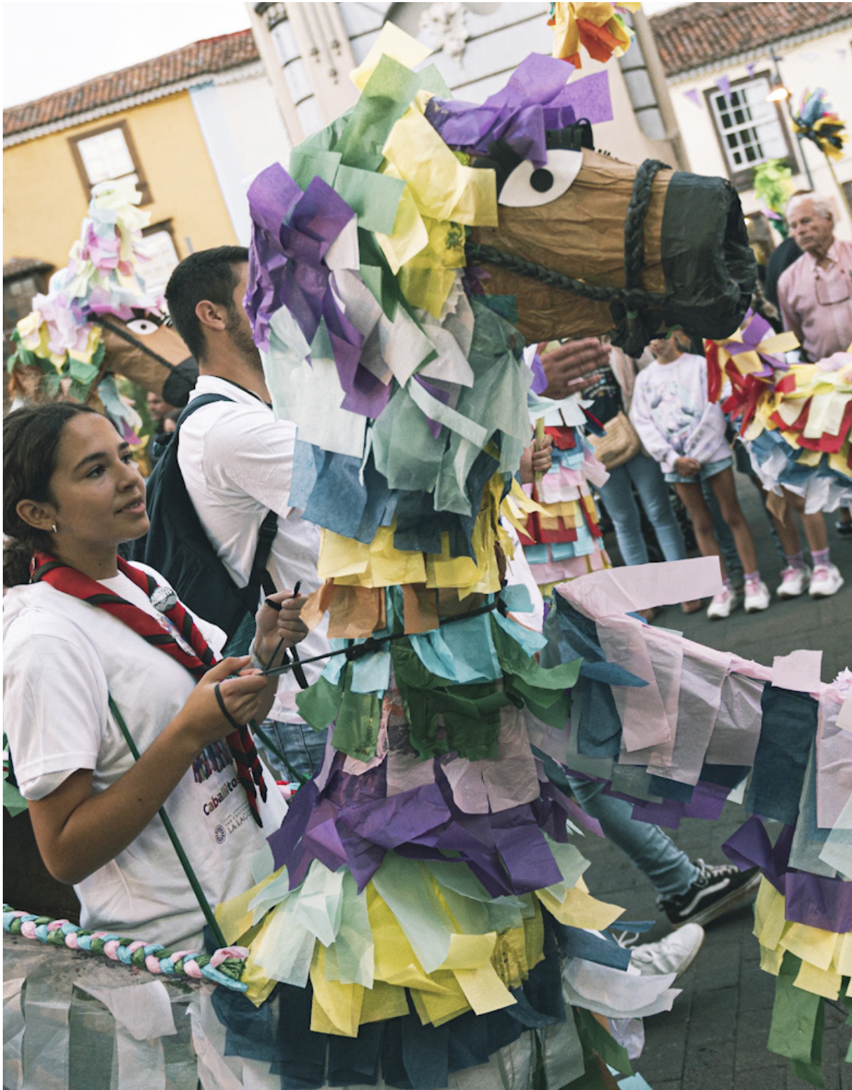
Desfile de la pandorga y los caballos de fuego, 13 de septiembre de 2022.