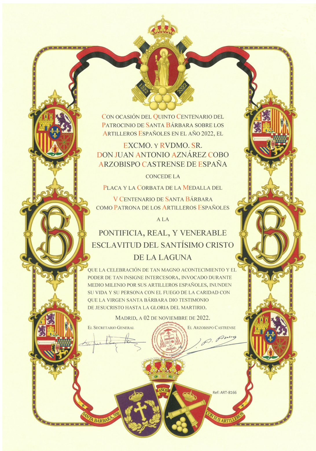
Cédula arzobispal de concesión de la Placa y la Corbata de la Medalla del V Centenario de Santa Bárbara a la Esclavitud.