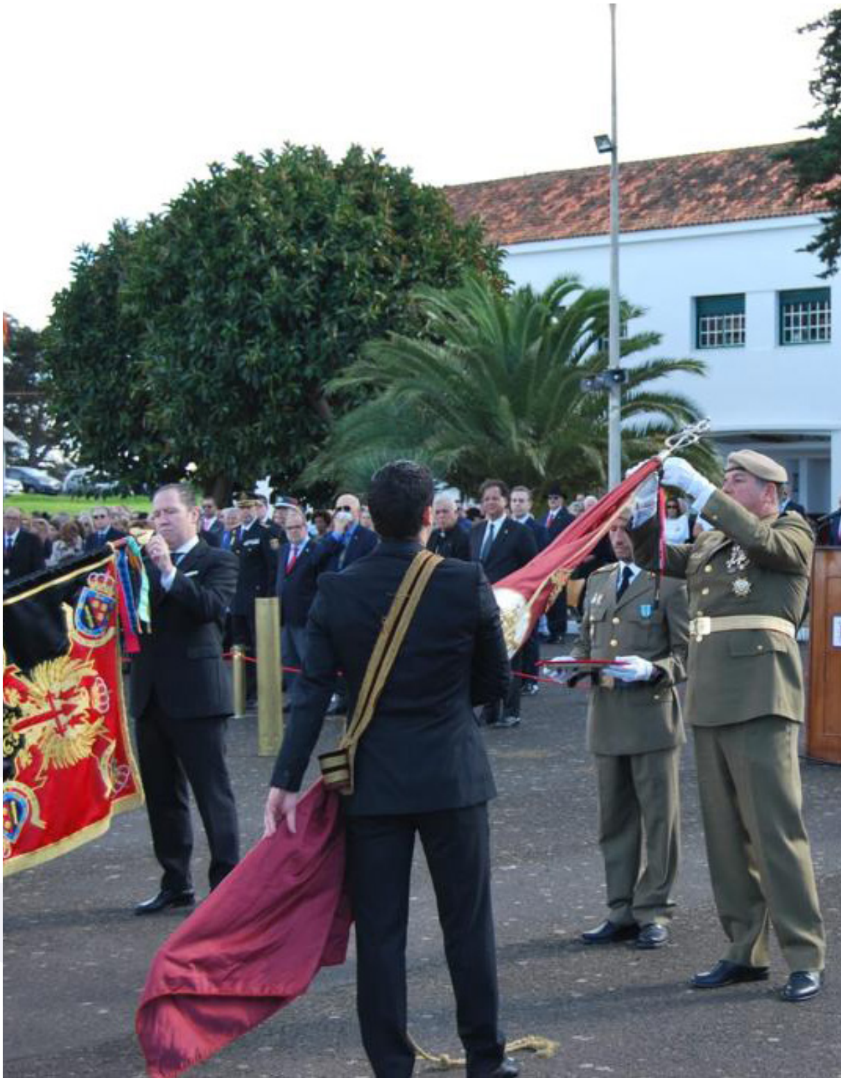
Imposición de las corbatas conmemorativas del Hermanamiento. 4 de diciembre de 2022.