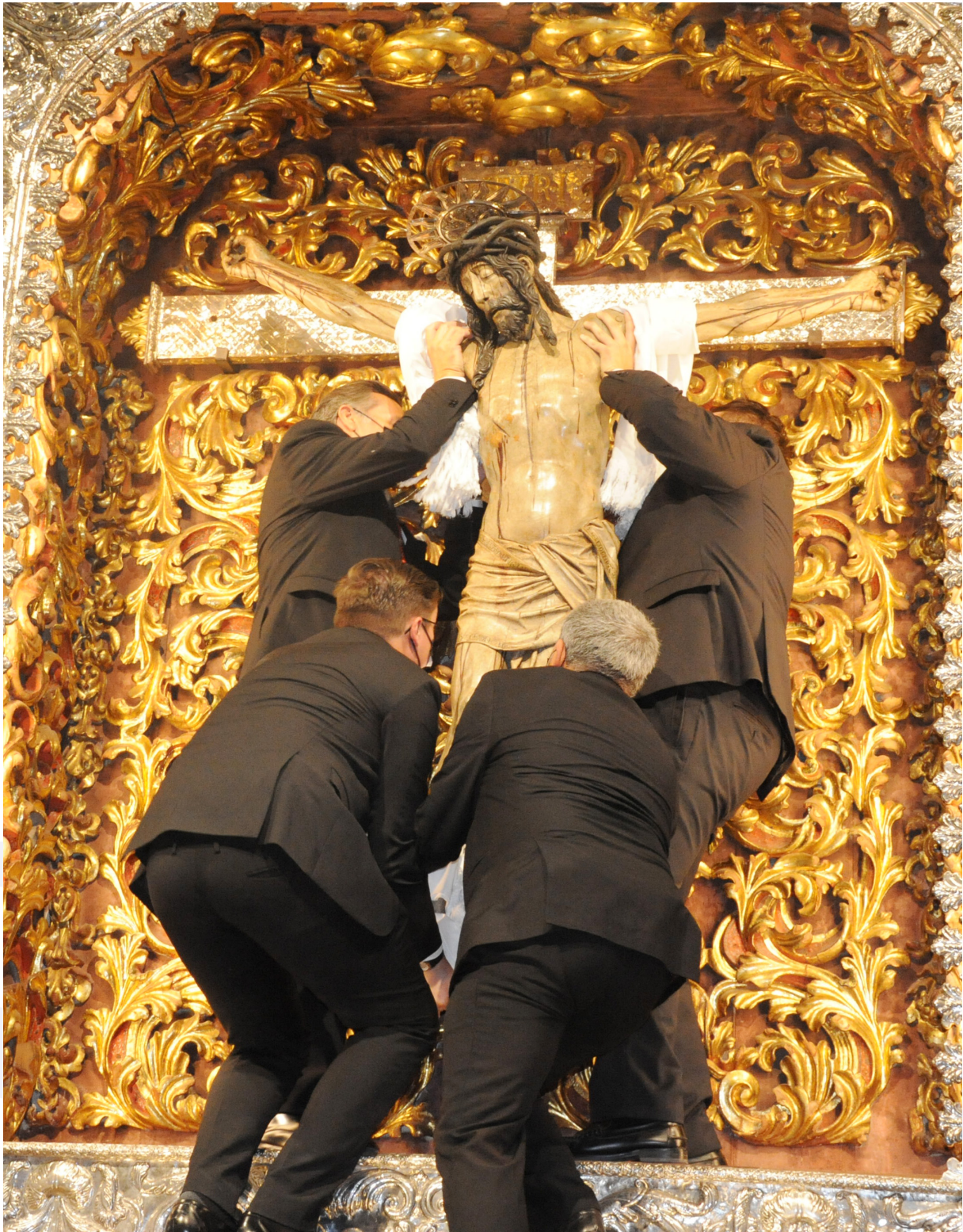
Retorno de la Venerada Imagen del Santísimo Cristo de La Laguna a su altar, 21 de septiembre de 2022.